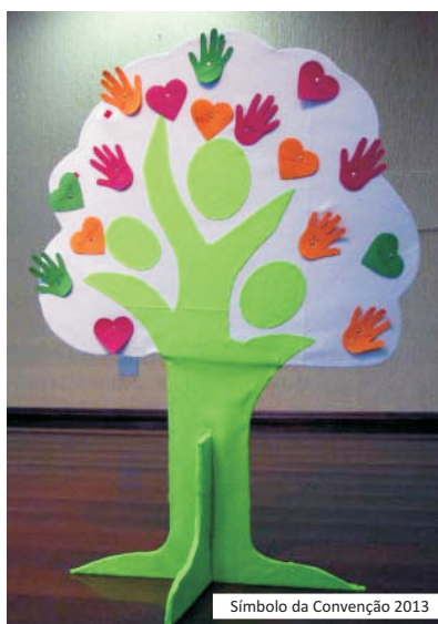
Símbolo da Convenção 2013