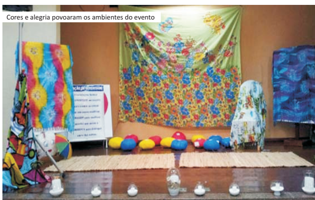
Cores e alegria povoaram os ambientes do evento

Solicitamos que os membros, coordenadores dos IGs, grupos isolados e grupos divulguem o Infojunccab, em todas as reuniões. O informativo é um meio de comunicação e integração entre a Junta Nacional e os CCAs do Brasil.