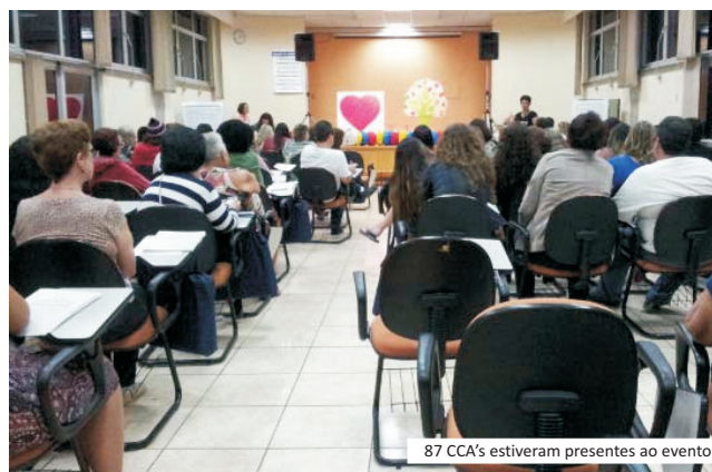
87 CCA's estiveram presentes ao evento

Mas voltando à "Junta de Serviço Comprometida"... Eu vi ali, na prática: a atuação do Comitê organizador (companheiras do Intergrupo do Interior de SP e outras colaborações de grupos e intergrupos). Fiquei refletindo so-