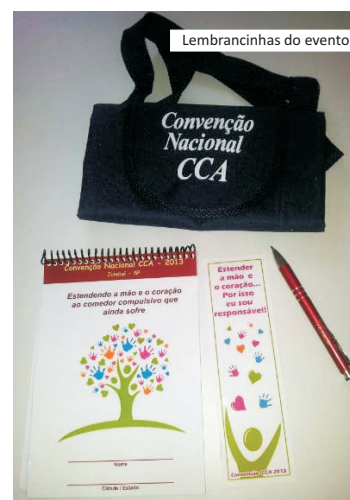
Lembrancinhas do evento

"Coloco minhas mãos nas suas porque juntos conseguimos o que jamais conseguiríamos sozinhos".